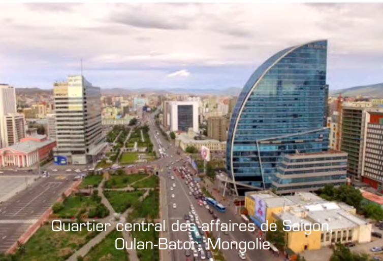
Quartier central des affaires de Saigon, Oulan-Bator, Mongolie