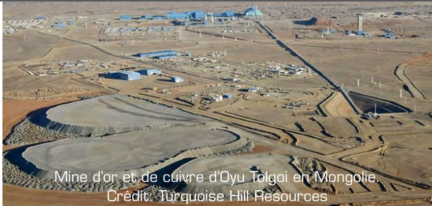
Mine d'or et de cuivre d'Oyu Tolgoi en Mongolie.

En outre, Turquoise Hills, dont le siège se trouve au Canada, possède la majorité d'Oyu Tolgoi; La mine la plus connue en Mongolie devrait plus que doubler la production d'or et investir 1,2 milliard de dollars dans le développement souterrain en 2018.